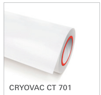
CRYOVAC CT 701