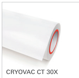
CRYOVAC CT 30X