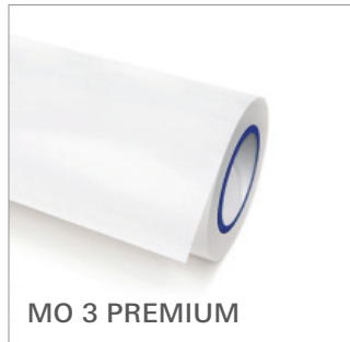
MO 3 PREMIUM